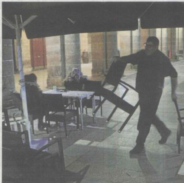
Un empleado de hostelería, uno de los sectores inspeccionados.

Una de las prioridades será reforzar el control de la contratación temporal injustificada. Y es que la dualidad del mercado laboral se ha en-