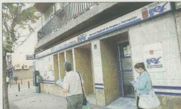
El SEF tiene abiertas varias líneas de ayudas para autónomos. CARM

El Servicio de Empleo y Formación (SEF) mantiene abiertas dos líneas para facilitar el establecimiento como autónomos de personas desempleadas. Una de ellas son las ayudas de entre 3.000 y 9.900 euros a aquellas personas sin empleo que se den de alta como